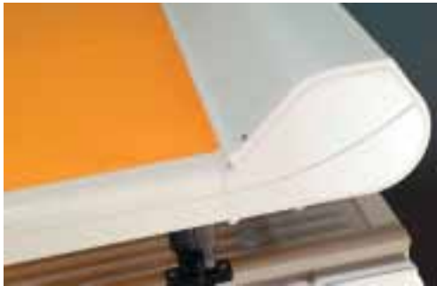
Forme du caisson du VZ510 Le caisson est constitué de profilés en aluminium profilé.