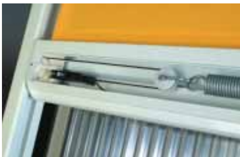
La toile et la barre de charge sont tendus en permanence grâce à un ressort, des petites roulettes et une corde Hi-tech très performante.