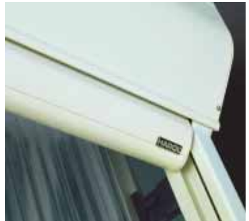
En position fermée, la barre de charge rentre partiellement dans le caisson ce qui protège la toile et donne un bel aspect extérieur.