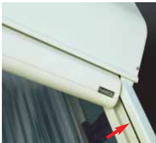
La corde Hi-tech, spécialement développée pour Harol®, assure une longue durée de vie à votre store véranda.

Le store véranda de Harol® combine une finition parfaite avec un aspect contemporain et s'adapte à la plupart des modèles de véranda existant sur le marché.