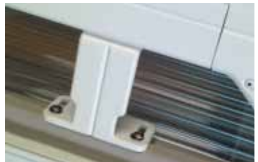
Des supports en aluminium pour fixer le store sur le toit de la véranda, d'origine avec le VZ520.