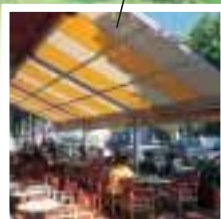
stores de terrasse