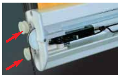
Le chariot à roulettes a été spécialement conçu pour permettre au système de fonctionner en douceur et silencieusement. Les roulettes peuvent, en outre, bouger latéralement, ce qui permet à la barre de charge de se déplacer facilement dans les glissières.