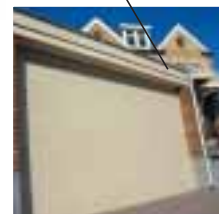
portes de garage à enroulement