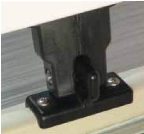
Des supports en matière synthétique pour fixer le store sur le toit de la véranda, d'origine avec le VZ510.