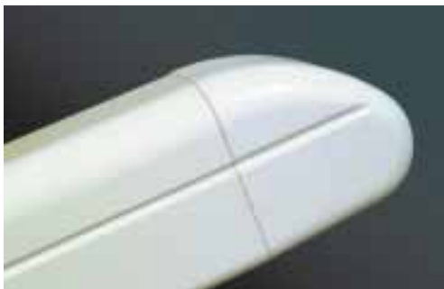
L'attention portée à l'aspect extérieur se remarque notamment à la forme arrondie des glissières.